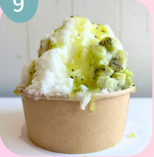
キウイ & キウイソース