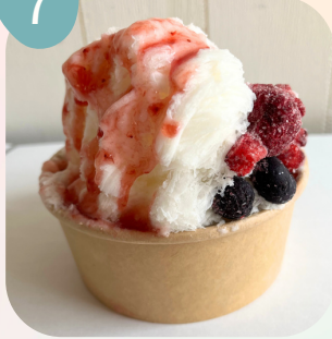
ミックスベリー & ストロベリーソース