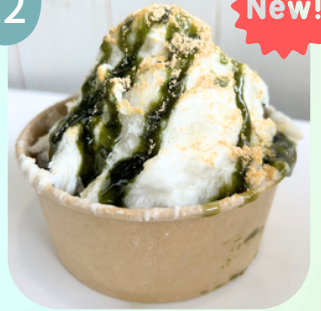
きなこ & 抹茶