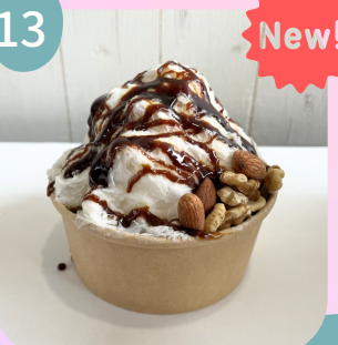
ナッツ & コーヒーソース