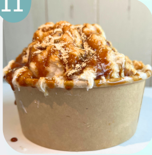
きなこ & 黒みつ