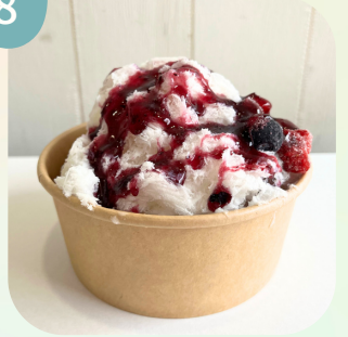
ミックスベリー & ブルーベリーソース